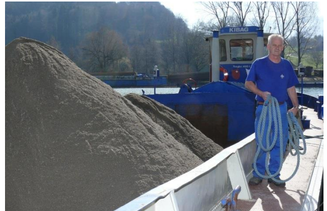
Der rundum zufriedene Schiffs- & Kranführer

Bedienerfreundlichkeit: Die fest eingebaute Bedingung wurde durch eine Funksteuerung ersetzt. In der Kranführerkabine kann die Funkfernsteuerung als feste und im Freien als mobile Bedienung genutzt werden. Der Kranführer verfügt damit einer einheitlichen Bedienung. Die stufenlose Bedienung dieser aller Antriebe wird bezüglich der betrieblichen Vorgaben und den sicherheitstechnischen Aspekten begrenzt.